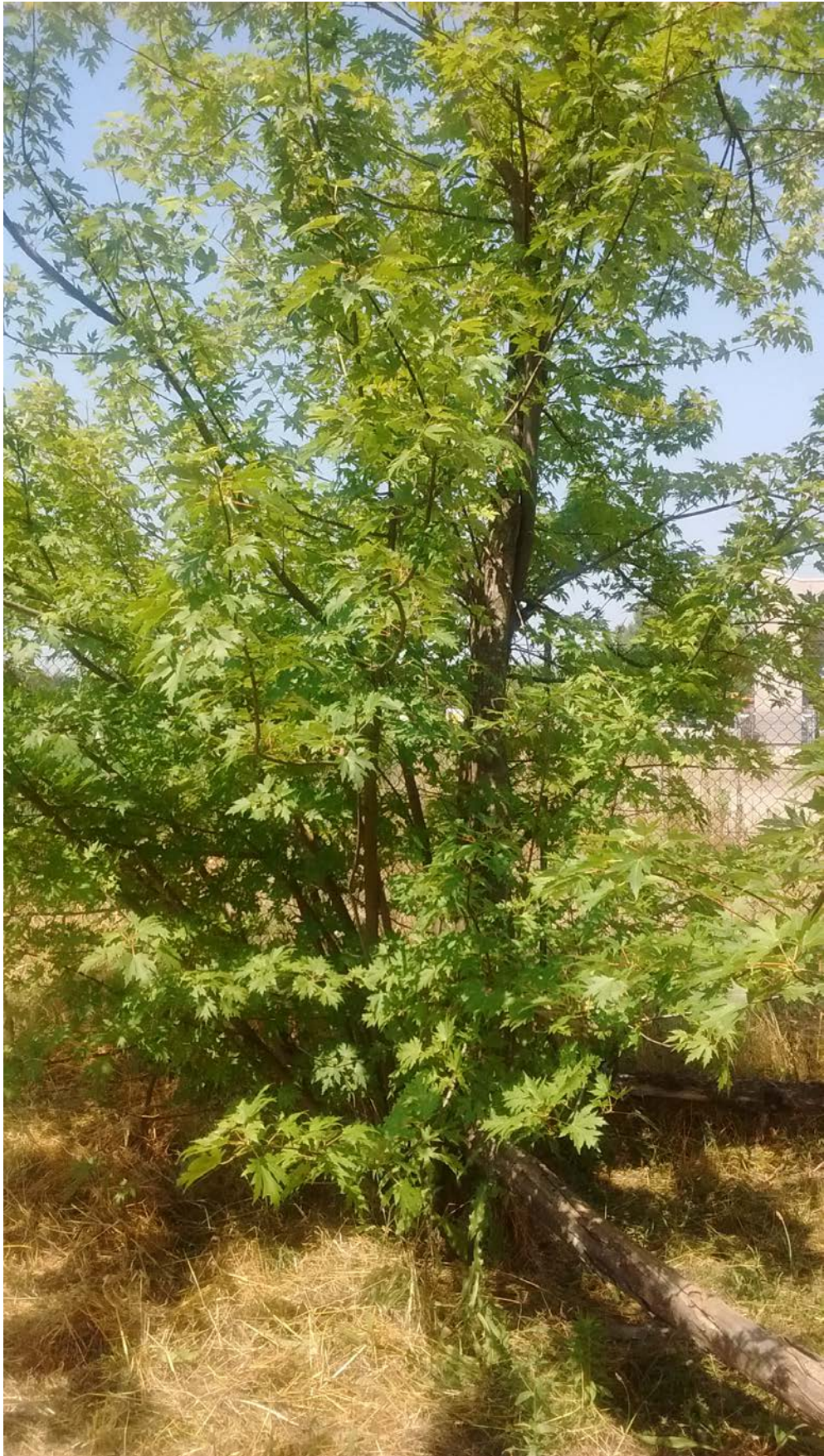
Figura n. 2 Esempio di Acer saccharinum in abbattimento