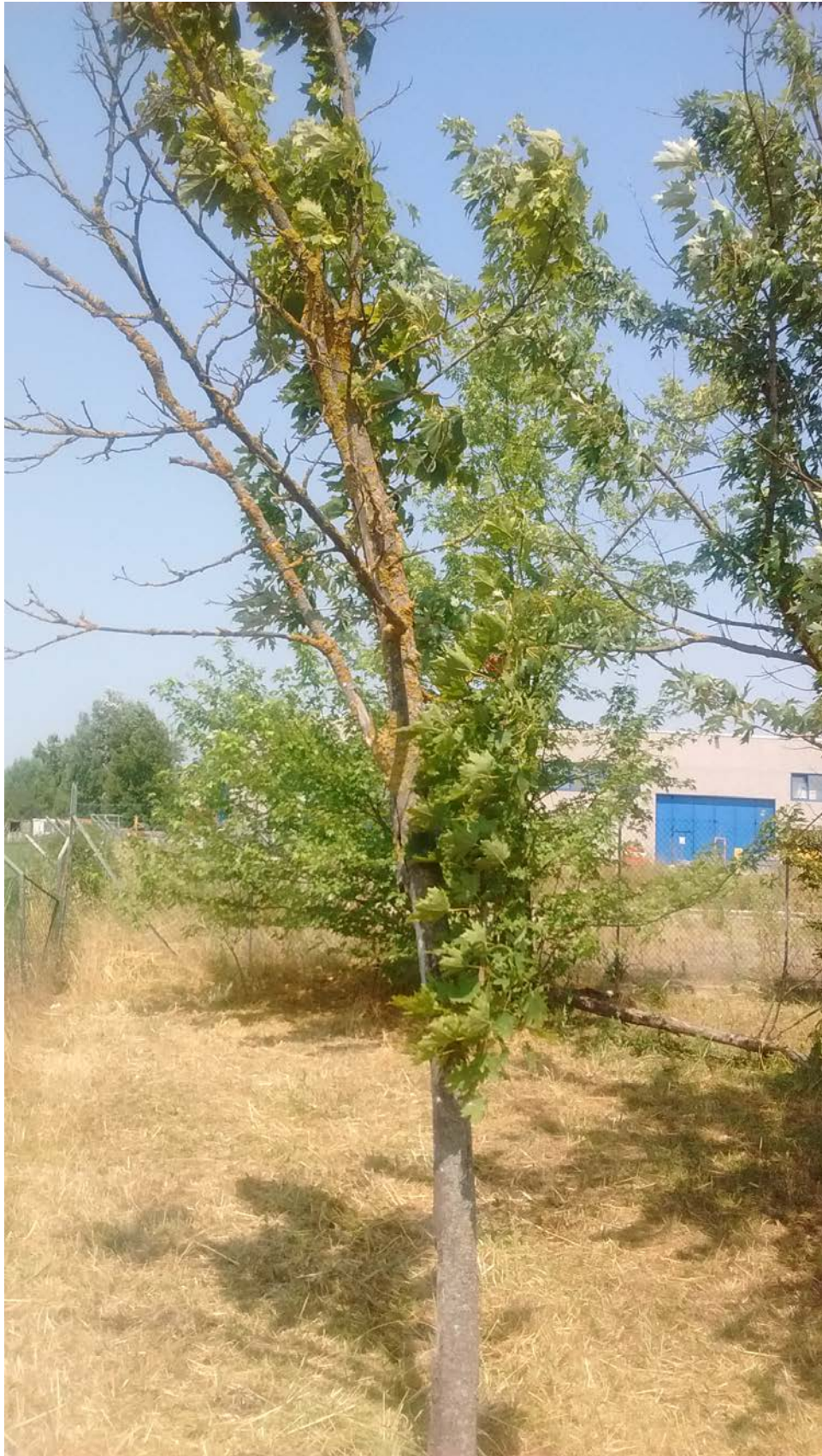
Figura n. 1 Esempio di Acer platanoides in abbattimento