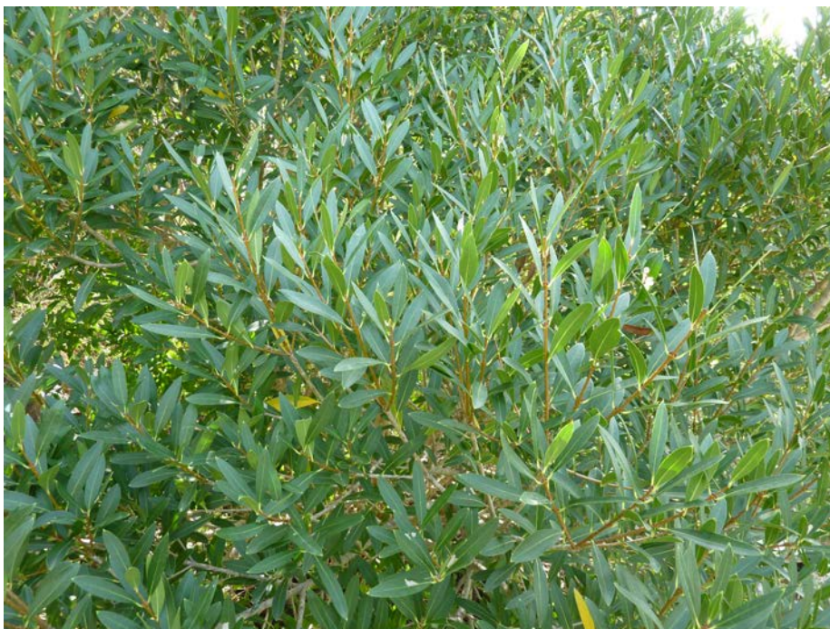
Figura n. 5 Esempio di specie arbustiva di progetto ( Phyllirea angustifolia ).

Le corti verdi all'interno dell'edificio Uffici PTS si qualificano come spazi ben visibili ma interclusi tra le pareti dell'edificio. Sono caratterizzate da un attento studio della vegetazione che predilige la scelta di specie vegetali adatte alle condizioni microclimatiche particolari proprie degli spazi circoscritti, piante resistenti ai patogeni, con sviluppo contenuto dell'apparato epigeo, quali Acer platanoides 'Crimson Sentry' a portamento piramidale.