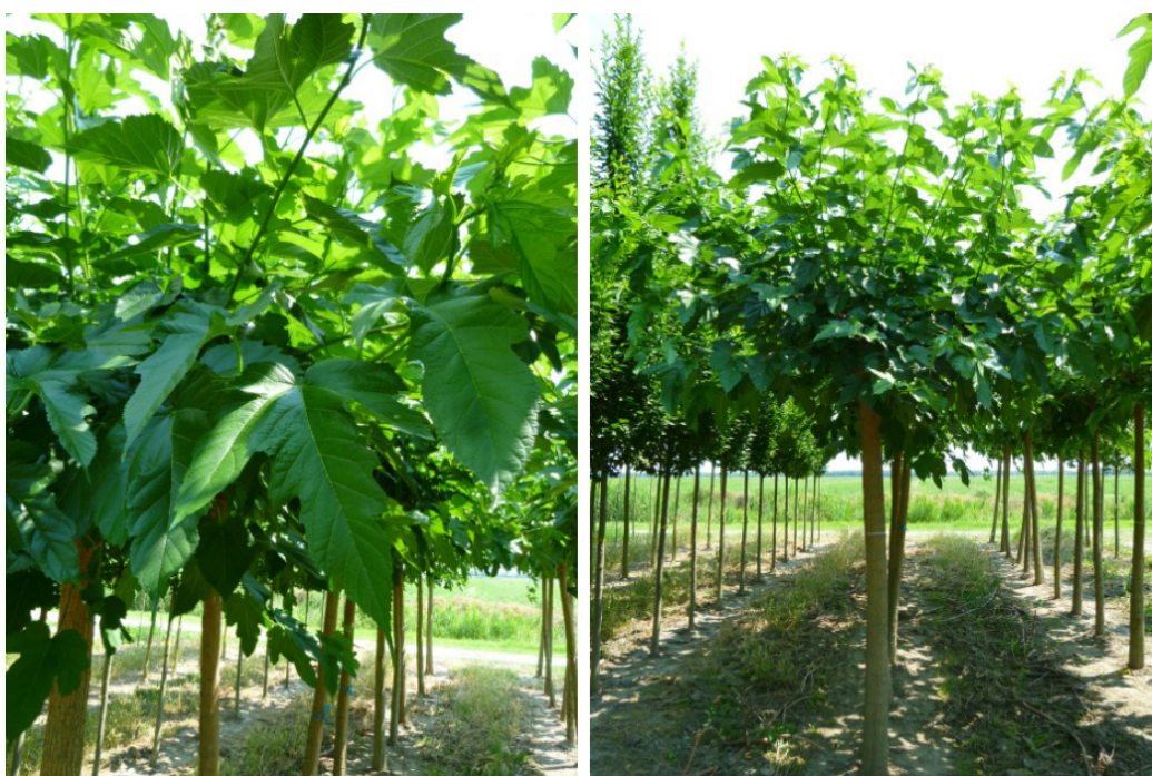
Figura n. 4 Esempio di specie arboree di progetto ( Morus plataniifolia 'Fruitless').

In generale trattandosi di piante a ridosso della sede stradale, sono state scelte tra le specie che presentano determinati requisiti, quali: resistenza ai diversi inquinanti atmosferici, resistenza alle malattie e rusticità, ridotte esigenze di manutenzione, resistenza agli agenti atmosferici avversi, resistenza alla siccità.