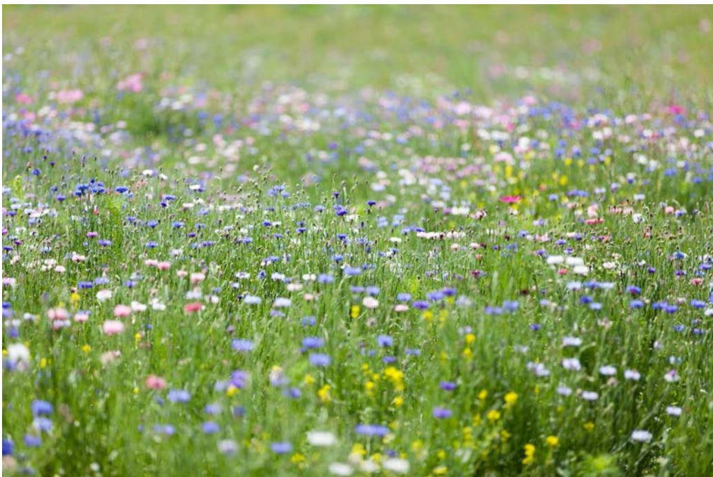
Figura n. 3 Esempio di trattamento di superfici a prato fiorito.

Il sistema a prato fiorito richiede bassi oneri di manutenzione, in quanto necessita di soli due sfalci all'anno, e presenta una capacità di resistenza allo stress idrico maggiore rispetto ad altre tipologie di tappeto erboso, con conseguente riduzione dei consumi idrici.